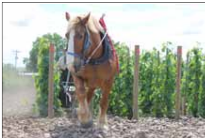
シュール エシャラ ヴィンヤード ゼッポ Sur Echallas Vineyardを耕すZepho

Horsepower Vineyardsもまた二頭の農耕馬'Red'と'Zeppo'を使って0.9m X 0.9mのスペースの間隔でフランス語で"surchalas"と呼ばれる一本の杭に葡萄樹を一本縛り付けた株立立ての葡萄畑を耕作しています。Horsepowerは伝統;それは今ではほとんどみられなくなった生粋の職人気質とその意識への回帰を表しています。それはニュー・ワールドに根付くオールド・ワールドへの窓です。