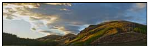
オー カテゴリー ヴィンヤード ワラ ワラ ヴァレー Hors Catégorie Vineyard (Walla Walla Valley)

価格は2020年1月1日現在のものです。価格、ヴィンテージは変更することがありますので価格表でご確認ください。