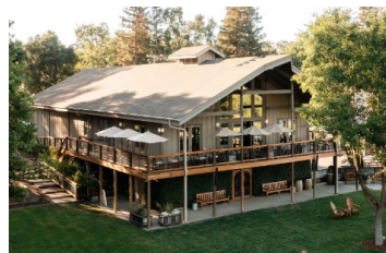
テイスティング・ルーム

FAMILY OWNED & OPERATED SINCE 1968 —1968年から続く家族経営—