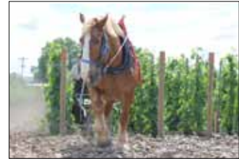
ゼッポ 農耕馬 Zeppo