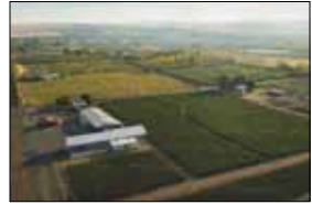
プロダクション・スタジオ