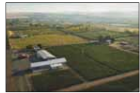
プロダクション・スタジオ

シラー カユール ヴィンヤード Syrah Cailloux Vineyard 2017